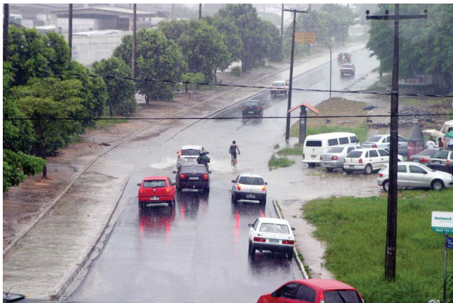
Águas inundaram a avenida Beira Rio, em João Pessoa, e provocou transtornos a moradores de comunidades de Cabedelo

A expectativa da Aesa agora é de que mais barragens que ainda não sangraram, alcancem sua capacidade máxima com as últimas chuvas, o que vai garantir mais tempo de abastecimento de água para o Estado.