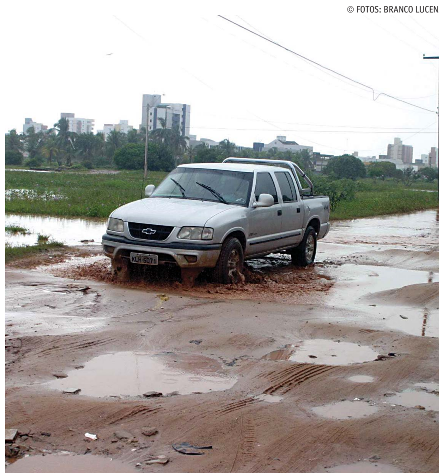
Alagamentos e buracos dificultam a vida dos moradores do Bessa, em João Pessoa

A Associação dos Moradores local afirma que advertiu a prefeitura para este problema. Eles requerem um muro de contenção pra reter a água e um sistema de drenagem para escoar o volume das chuvas, de modo a evitar maiores tragédias. Na Capital, também foram registrados pequenos deslizamentos de terra na barreira do Cabo Branco e nos bairros do Roger, na comunidade Maria de Nazaré, bairro São José,