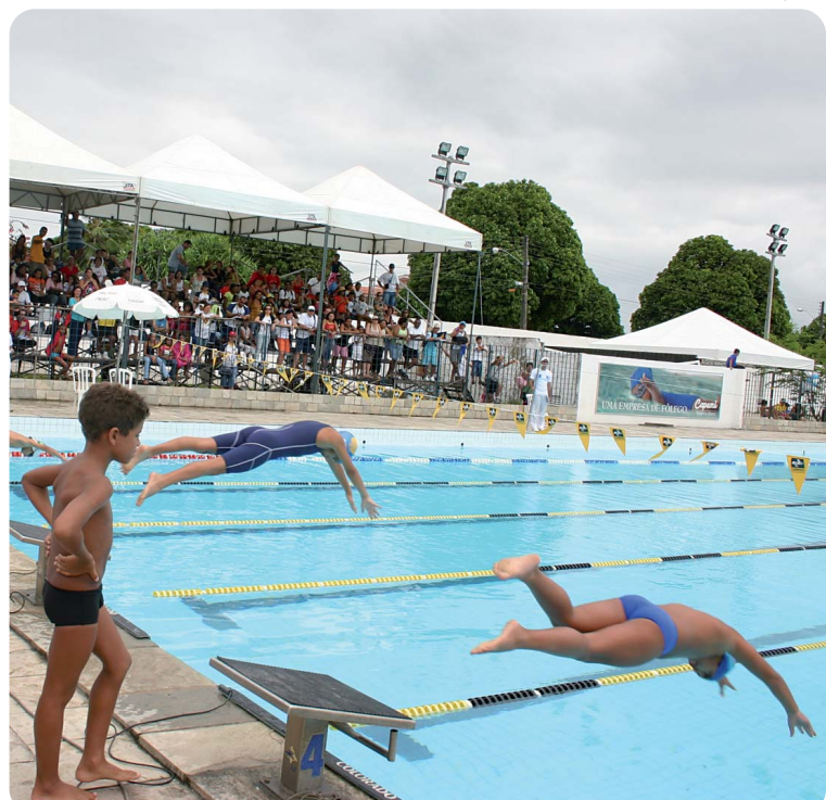
Os paraibanos que se destacaram treinam na Vila Olímpica Ronaldo Marinho