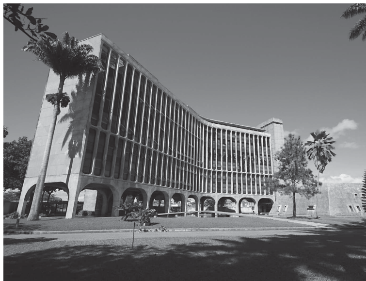
Durante três dias, o evento acontece na Federação das Indústrias da PB

O encontro contará ainda com a presença de representan-