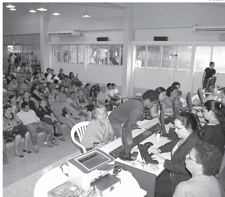
Mais de 300 pessoas receberam senha de atendimento na sede da Cehap