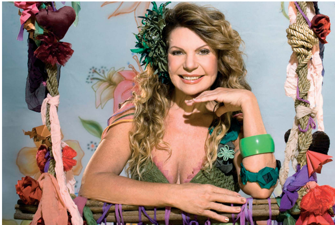
Em 'Balaio de Amor', Elba não propõe uma revolução sonora, mas consegue oferecer MPB de qualidade

■ Trinta anos depois de sua estreia com o lançamento do LP 'Ave de Prata', cantora apresenta aos fãs mais um manifesto de nordestinidade