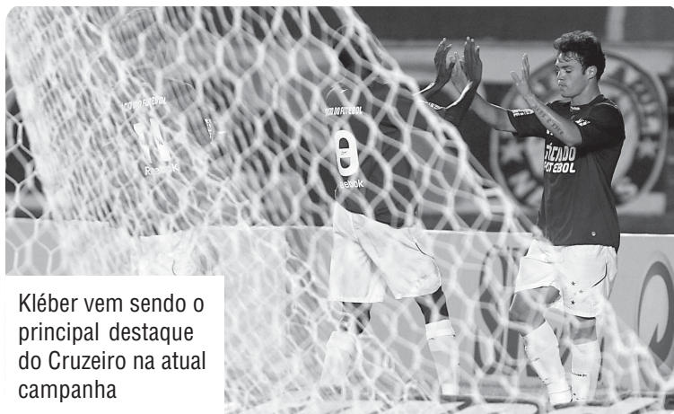
Kléber vem sendo o principal destaque do Cruzeiro na atual campanha