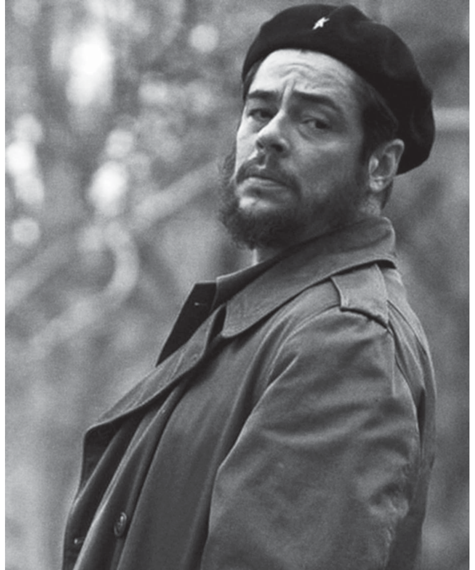
O ator Benicio Del Toro interpretando o guerrilheiro Ernesto Che Guevara em cena de 'Che'

47 BANCO 3/aso — cá. 4/naum — nula — rosé — siam. 10/episcopisa — pasmaceira.