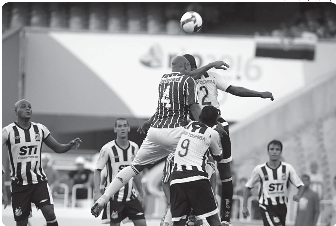
O Santos começou perdendo e se reabilitou ao aplicar uma goleada de 4 a 1 na equipe de Parreira no Maracanã

O Mengão se recuperou e, também com quatro pontos, aparece na 10ª posição. O Sport parece que não é o mesmo desde a eliminação na Libertadores diante do Palmeiras. O time pernambucano foi esmagado pelo Atlético-MG e perdeu, por 3 a 2, em plena Ilha do Retiro.