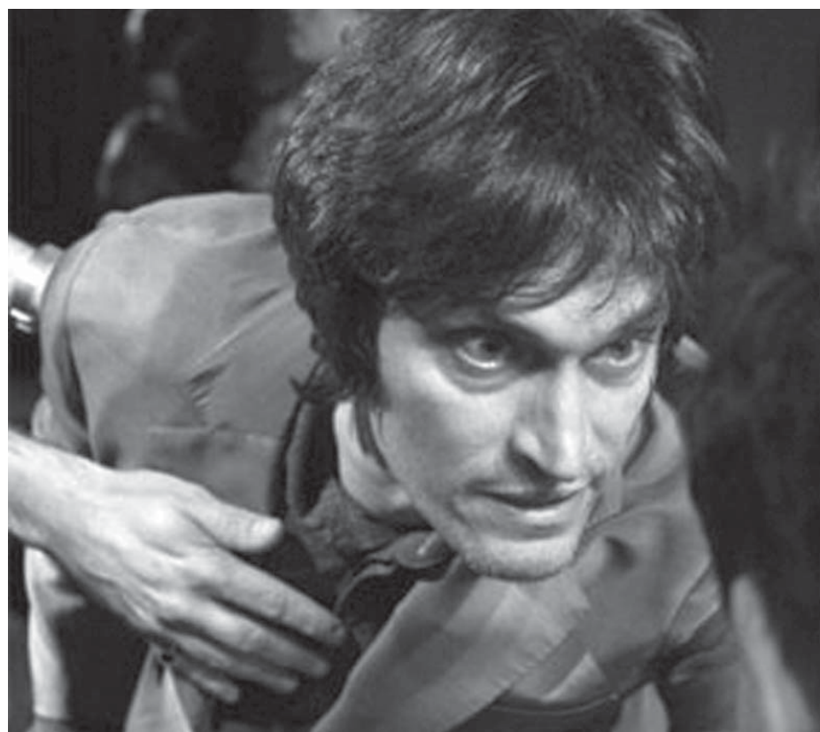
Cena de Tetro, filme que Coppola inscreveu na Quinzena dos Realizadores, em Cannes

As justificativas estão fora e dentro dos filmes, por assim dizer. Segundo o próprio Coppola, seu filme não teria ficado pronto a tempo de encontrar uma vaga no concurso oficial, motivo que minimizaria um possível embate entre o cineasta e a direção do festival. Coppola ainda teria frisado que não se sentiria a vontade de integrar a competição pelo caráter independente de