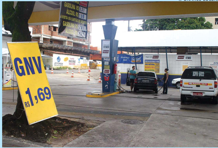
Preço do metro cúbico do gás já está sendo oferecido a R$ 1,69

A gasolina já pode ser encontrada a R$ 2,09, o álcool a R$ 1,49. Pesquisa realizada pelo Procon mostra que